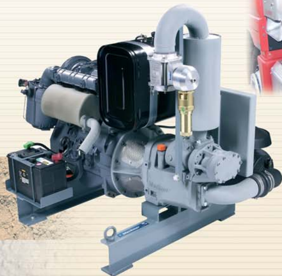
Diesel getriebenes System