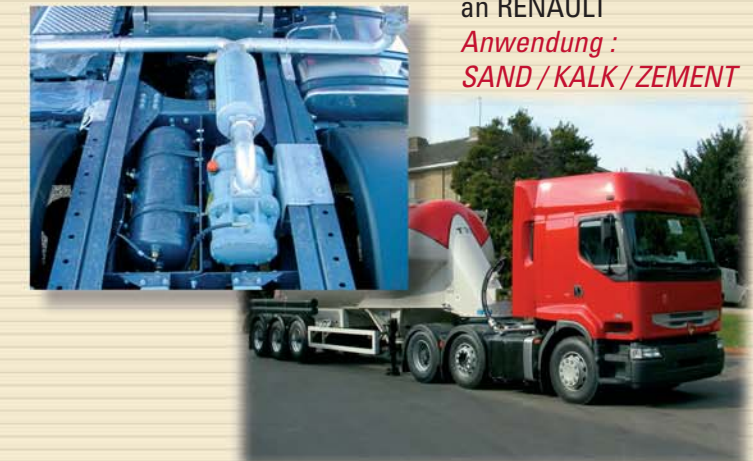
MISTRAL DDK an RENAULT Anwendung : SAND / KALK / ZEMENT