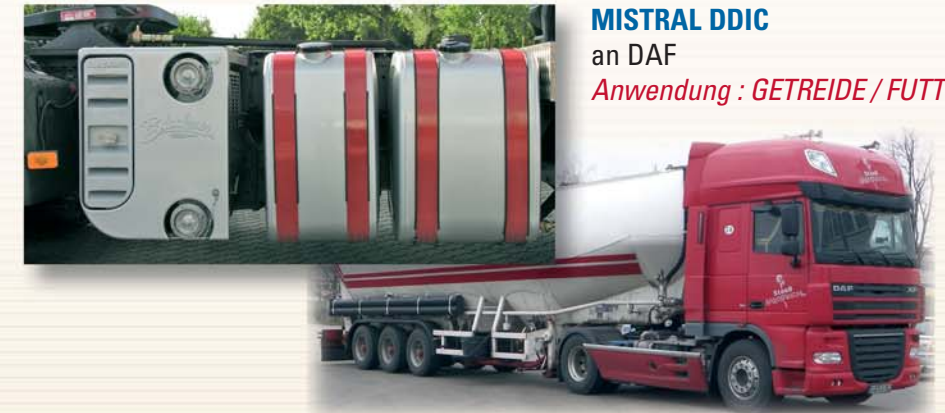
MISTRAL DDIC an DAF Anwendung : GETREIDE / FUTTERMITTEL