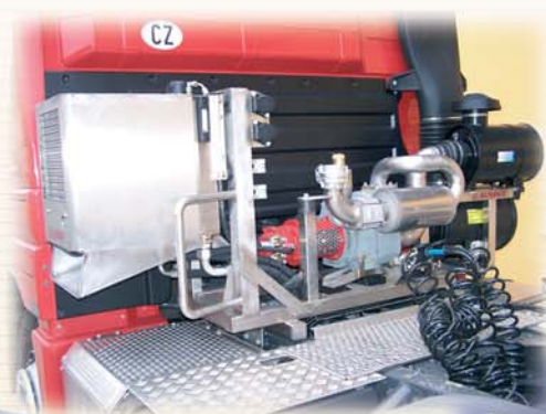
Elektrisch getriebenes System