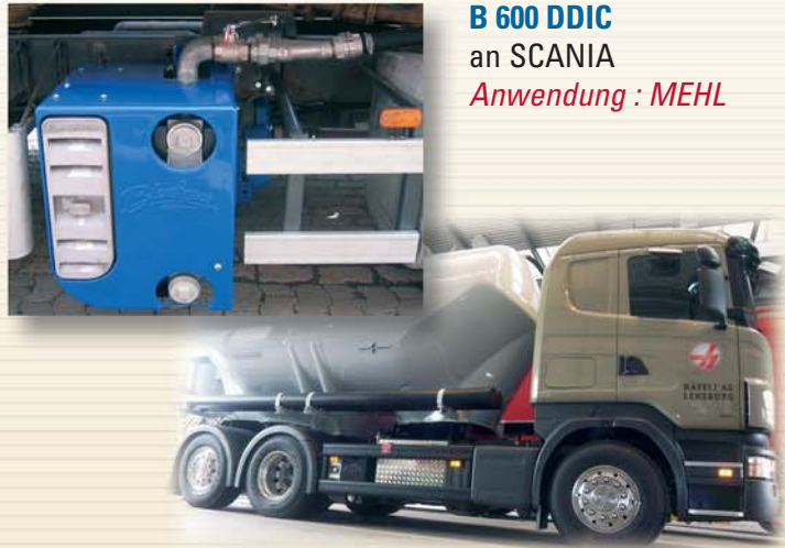
B 600 DDIC an SCANIA Anwendung : MEHL