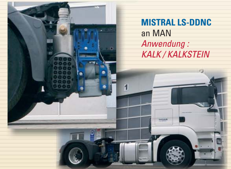
MISTRAL LS-DDNC an MAN Anwendung : KALK / KALKSTEIN