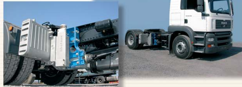
B 600 DDNC an MAN Anwendung : KALK / ZEMENT